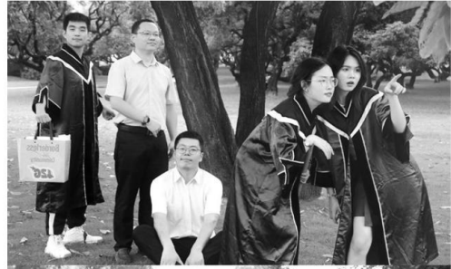
学生与导师一起拍摄“西游记”同款毕业照

创意约拍、梗图模仿、转场视频……如今的毕业照拍摄不再是单一的留影仪式,而是年轻人展示个性、表达情感、与同伴共创留念的过程。多样化的记录方式背后,是Z世代(通常是指1995年至2009年出生的一代人)对青春纪念仪式的重新定义。在拍什么、怎么拍、和谁拍的选择中,不同的身份认同、情感需求与消费观念也随之交织,勾勒出一幅当代大学生青春表达与自我呈现的新图景。