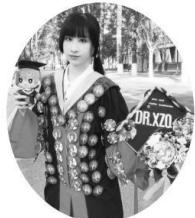
冰蓝笑改造的博士服