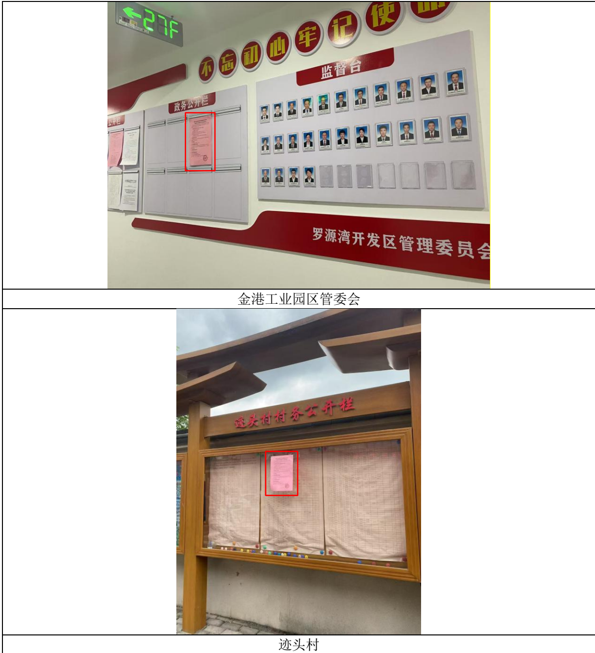
图 3.2-2 张贴公告现场

我公司于网站发布征求意见稿公示后，前往环境影响评价范围内敏感目标张贴公示，向公众公开项目及环境影响报告书征求意见稿下载途径。张贴公示的区域包含金港工业园区管委会、迹头村。张贴公示现场见图 3.2-2。