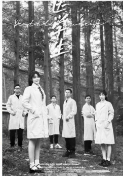
医学生拍摄的毕业照